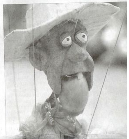
Image vivante d'un cow-boy solitaire.